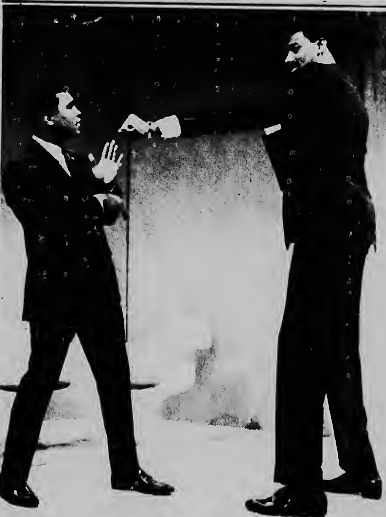
NEW YORK—Campeon mundial di peso pesado Cassius Clay na man robes, mester mira na larja, pa e observa e jab di e homber di siete pia y un inch, Wilt Chamberlain, quende ta un hungador di basketball profesional, ora nan a topa pa un entrevista na television Chamberlain a bisa cu e ta cla pa hasi su debut como boxeo y Clay a bisa cu e ta dispuesto pa bringa cune despues di dos of tres pelea.